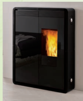
TINY kW 9 schwarzer Keramik-Mattweiß-rot black, red and matt white ceramic