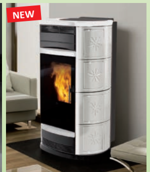
SIRENA kW 13,2 Keramik elfenbeinfarbene-rot-Ledereffekt/ cream white, red and leather ceramic FATA kW 13,2 Keramik rot-elfenbeinfarbene-Ledereffekt/ cream white, red and leather ceramic