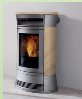
SPACE kW 11 Sandstein/ sandstone