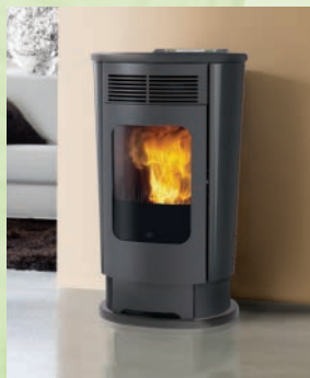
LOGO kW 9 Keramik grau grey ceramic