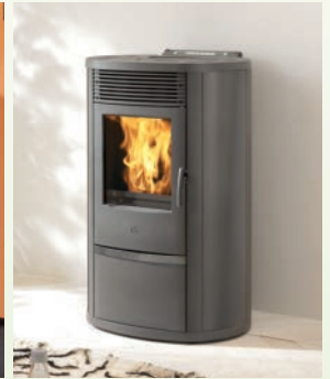
LILIA PLUS kW 8 grauem Stahl elfenbeinfarbene Keramik-weinroter, lachs-farbene-grauer Keramik-Naturstein/ grey steel, soapstone, bordeaux, apricot, grey and cream ceramic