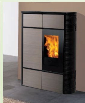
NANCY kW 9 Schwarzes Gusseisen und Holz-Effekt Laminam-"Corten-Effekt"-cremeweißes/ wood effect "laminam", corten effect "laminam" and cream white "laminam"