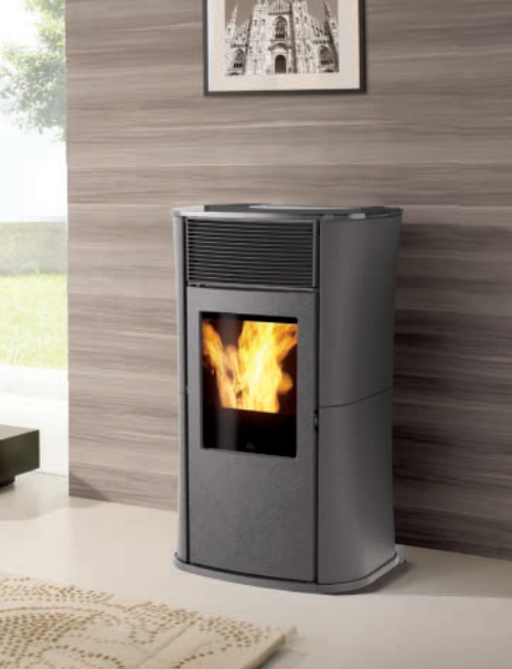
MYA kW 6,5 Seitenteile aus dunkelgrauem Stahl, Top aus dunkelgrauem Glas und Vorderseite grau/ covering in steel and dark grey glass