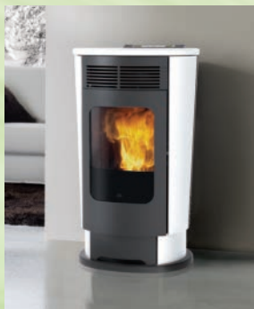
LOGO kW 9 Keramik altweiß-Keramik weinrot cream, white and bordeaux ceramic