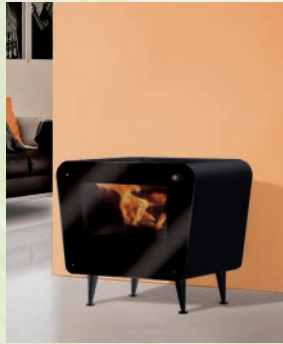
BRIO kW 7,5 Schwarz lackierter Stahl-Grau lackierter Stahl/ black painted steel and grey painted steel