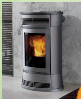
FUNNY kW 11 Seitenteile aus grauem Stahl, Ober- und Zier-teile aus grauer Keramik-elfenbeinfarbene-rote/ grey steel and grey, cream white or red ceramic top