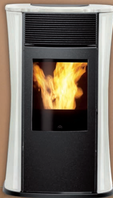
MYA kW 6,5 Verkleidung aus Weissem Glas/ white glass covering

Kleiner Pellet-Heizofen mit originellem Design, Stahlstruktur, Tür aus Gusseisen und kontrollierter Belüftung (Zwangsbeflüchtung); Funksteuerung mitgeliefert. Hinterer oder oberer Rauchabzug. Kit für Rauchgasabführung oben und Kit Rohrhülse (Optional).