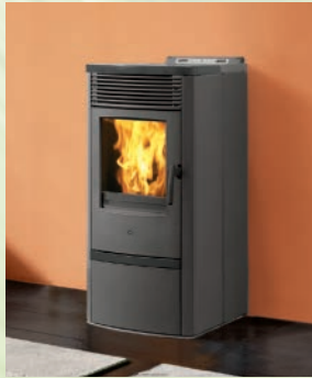
SEVEN kW 7 Stahl grau und Zierteile aus grauer Stahl bordeaux-lederer keramik-weißer Keramik/ grey steel, leather, bordeaux, white