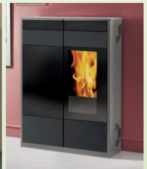
KELLY kW 9 Stahl Perlgrau -Stahl weinrot/pearl grey and bordeaux steel