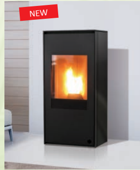
LOU kW 8 DER ECHE TE RAUMLUFTUNABHÄNGIGE OFEN / TIGHT STOVE Anthrazitgrauem Stahl/ anthracite-grey steel