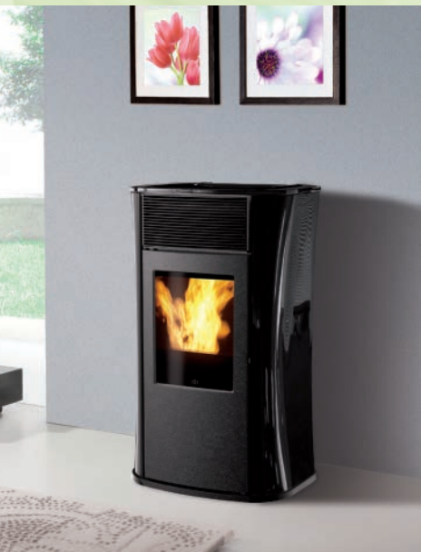
MYA kW 6,5 Verkleidung aus Schwarzem Glas/ black glass covering