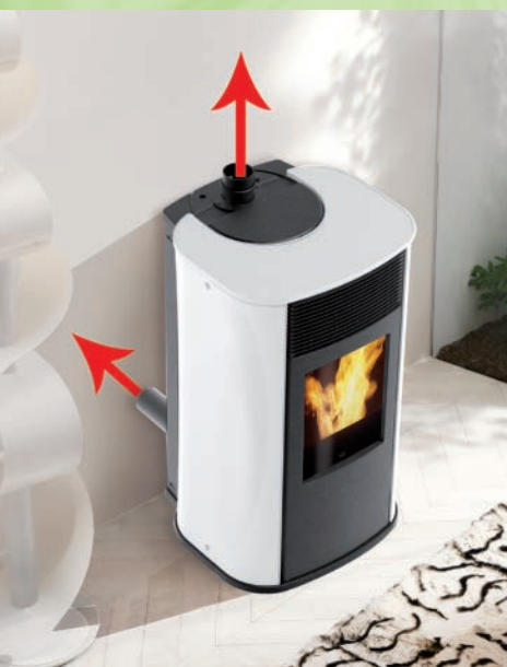
Rauchanschluss oben oder hinten (optionales Kit)/ Smoke outlet can be on top or at the rear (optional kit).