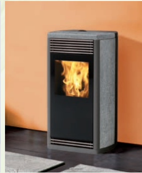
FLEXA kW 8 Naturstein-mattweiße Keramik-rote Keramik-grauer Keramik und Seitenteile aus grauem Aluminium/ soapstone, matt white and red ceramic, grey steel