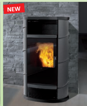
STORY kW 13,2 Stahl grau/ grey steel FANTASY kW 13,2 Naturstein/ soapstone