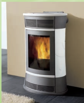
CHERIE kW 11 elfenbeinfarbene Keramik-hasel-nussfarbene-rote/ cream white, hazelnut and red ceramic